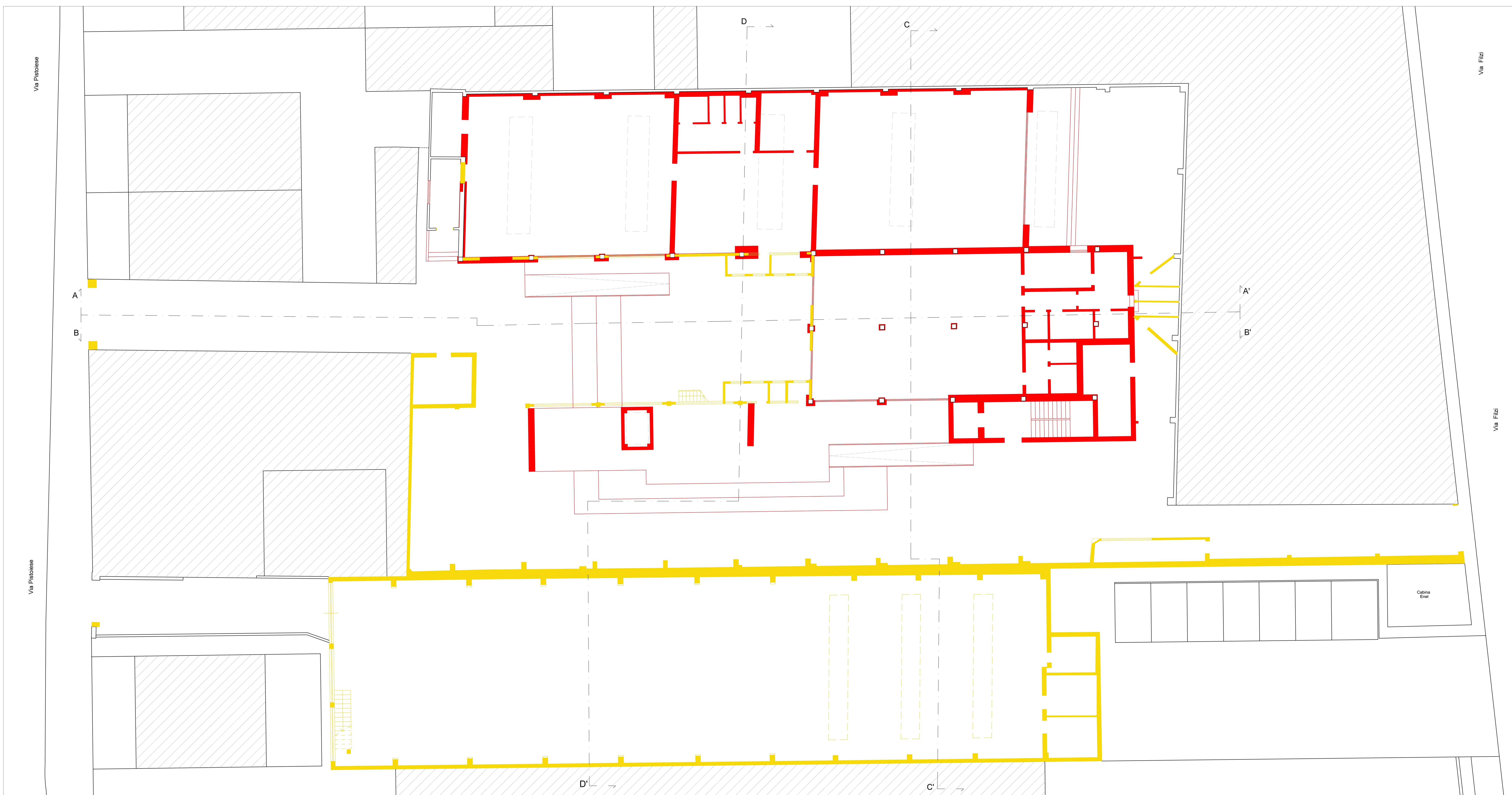
Pianta piano terra Stato sovrapposto_Scala 1:100