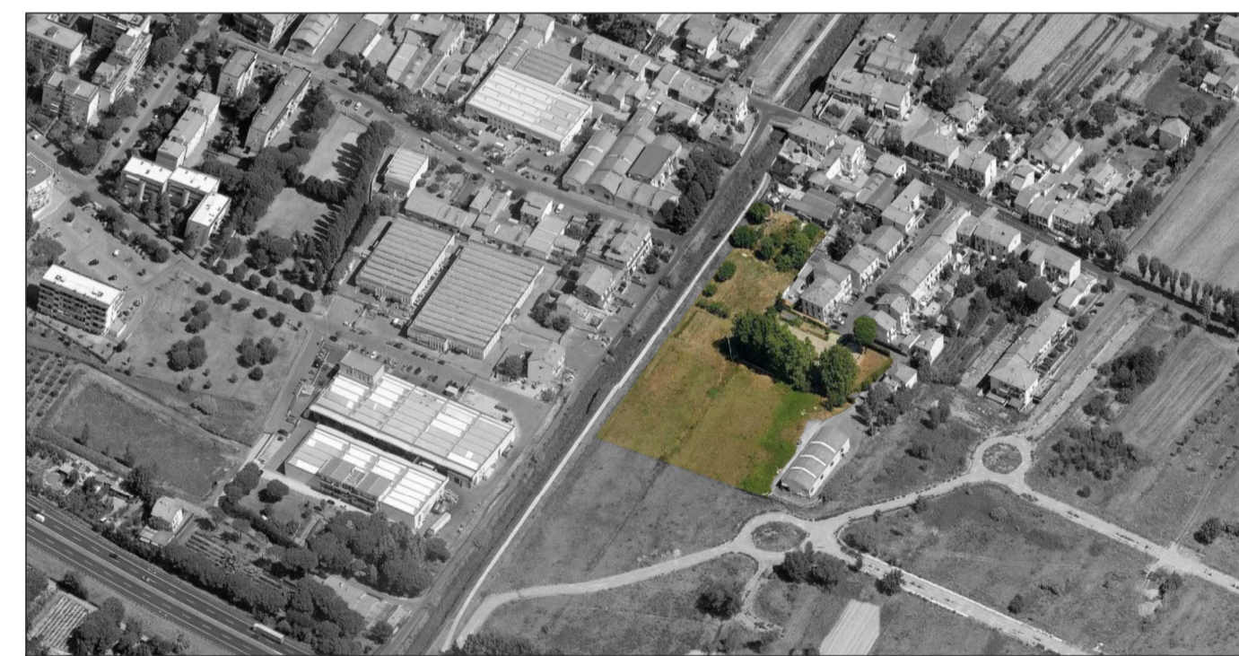
Vista panoramica lato sud-est