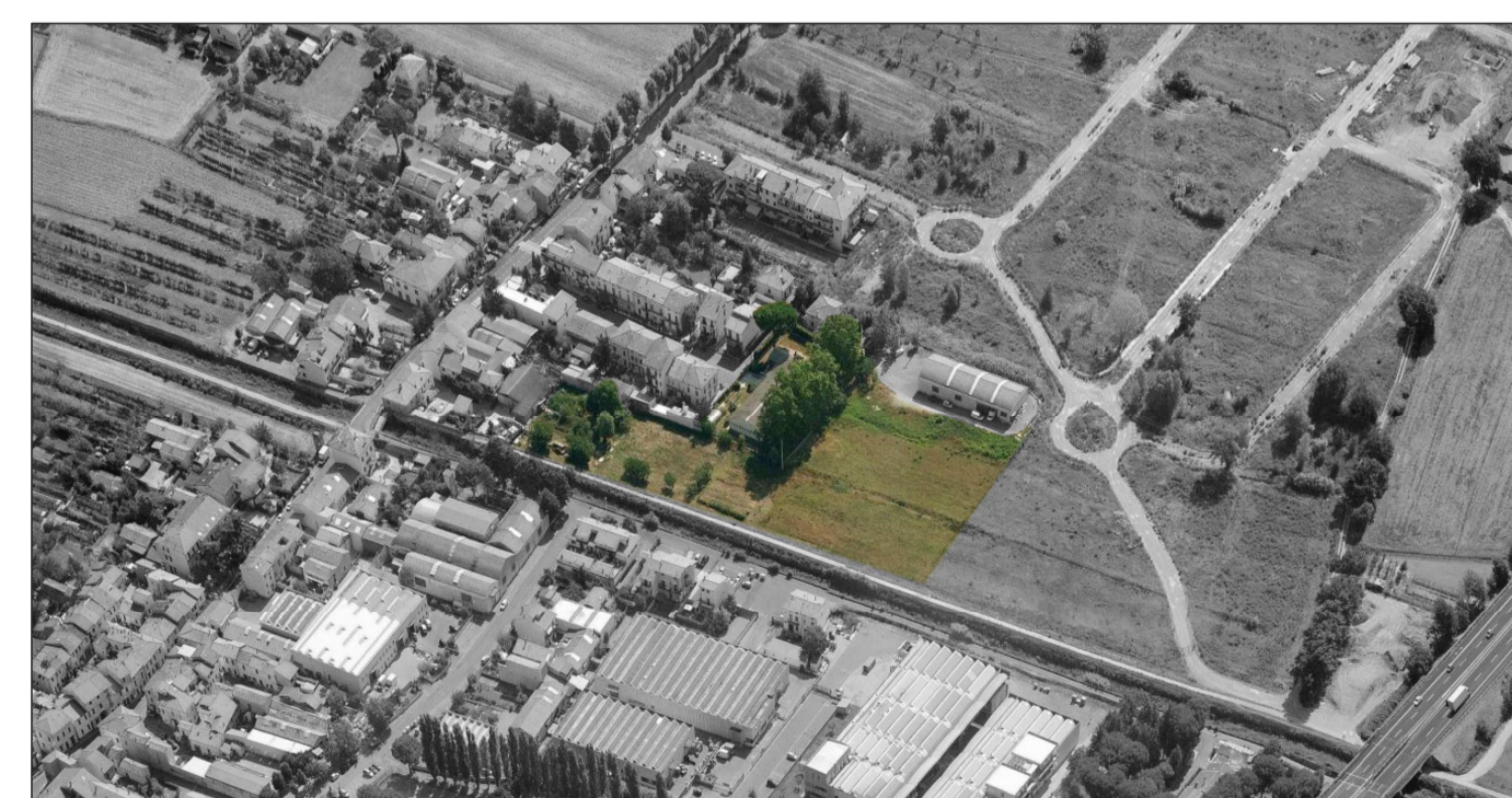
Vista panoramica lato sud-ovest