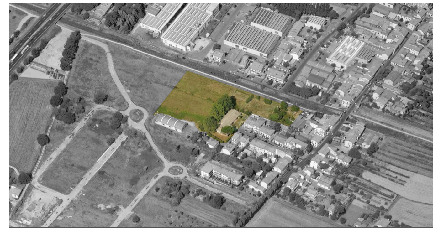
Vista panoramica lato nord-est