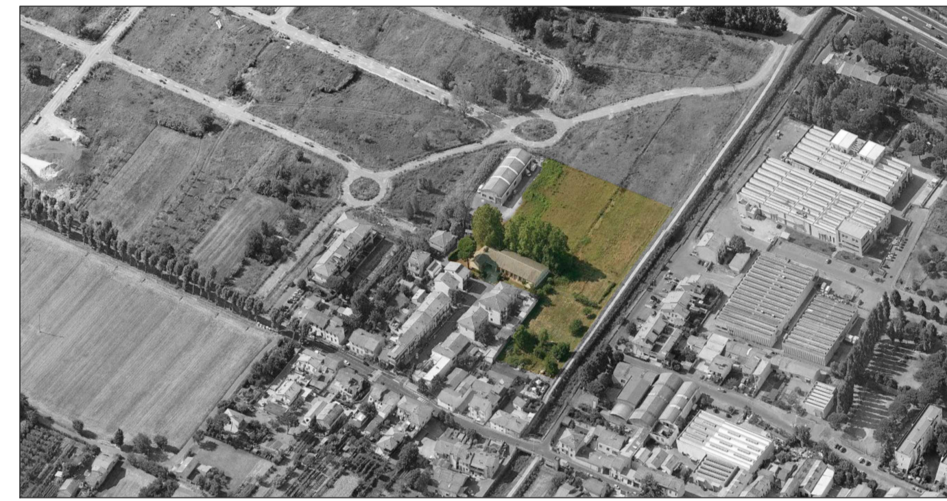
Vista panoramica lato nord-ovest