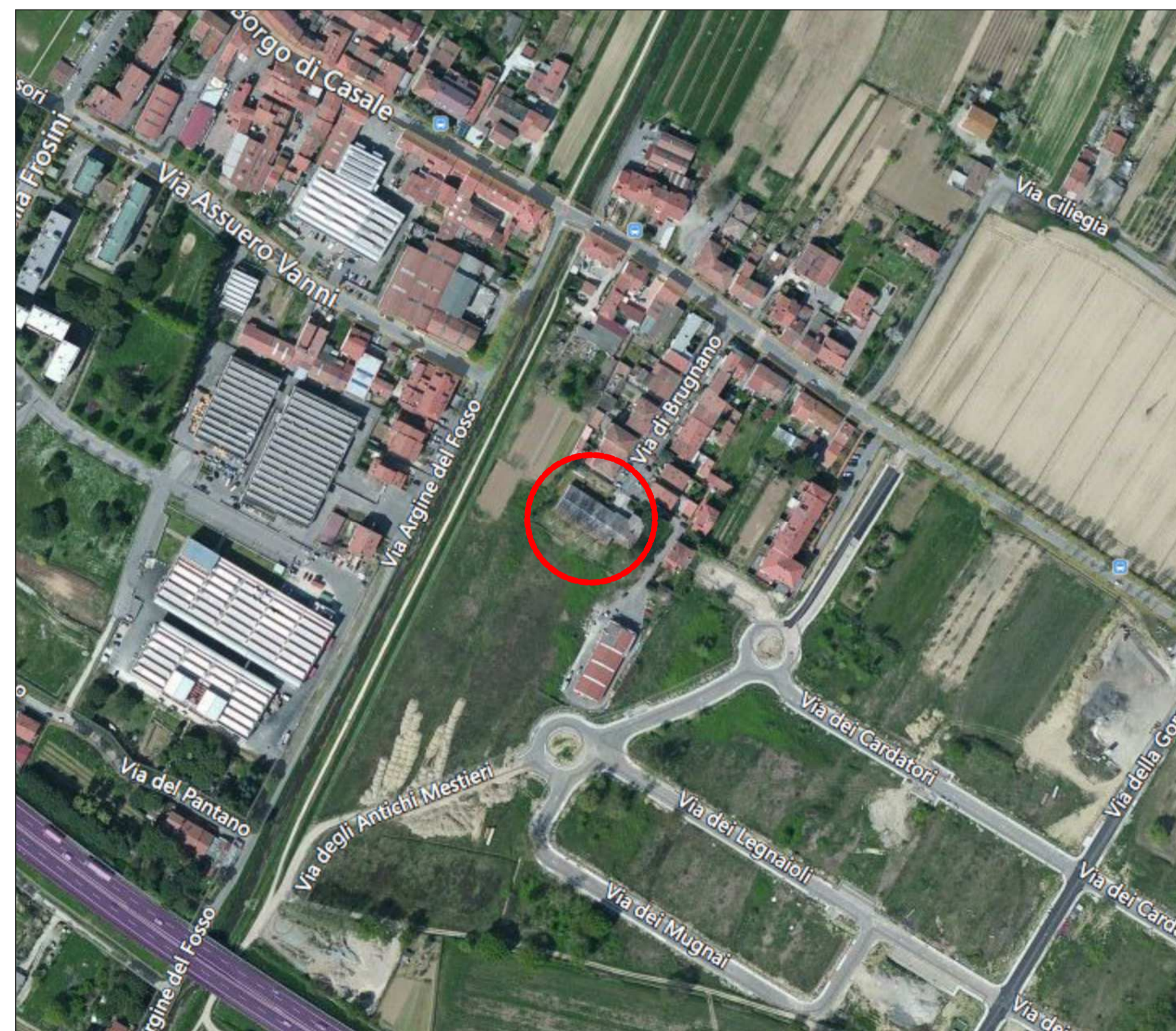
Ripresa Aerea dell'area di intervento