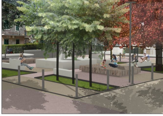
Tavola: n. 9 Scala: 1:100

© Copyright Comune di Prato - Servizio Lavori Pubblici è vietata la riproduzione anche parziale del documento