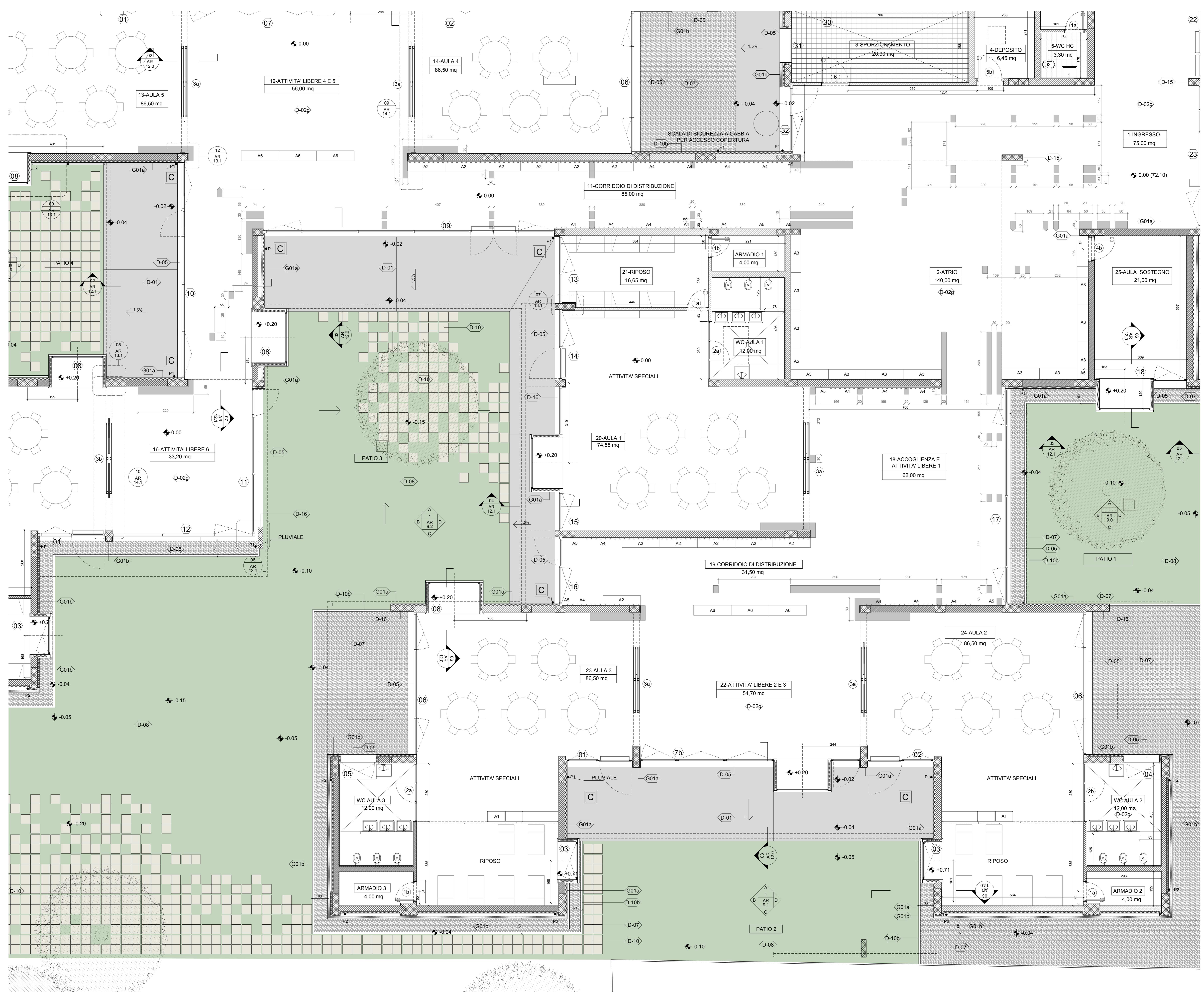
01 Pianta degli interni - Stralcio 1 1/50

NOTE GENERALI: 1) I DISEGNI A SCALA 1:500, 1:200 e 1:100 SONO QUOTATI IN METRI 2) I DISEGNI A SCALA 1:50, 1:20, 1:10 e 1:5 SONO QUOTATI IN CENTIMETRI 3) NELLE FINCATURE I CODICI TRA PARENTESI FANNO RIFERIMENTO ALL'ELENCO MATERIALI E FINITURE TAV. AR.1.0 E AL DOCUMENTO DD.1.1 SCHEDE DEI MATERIALI