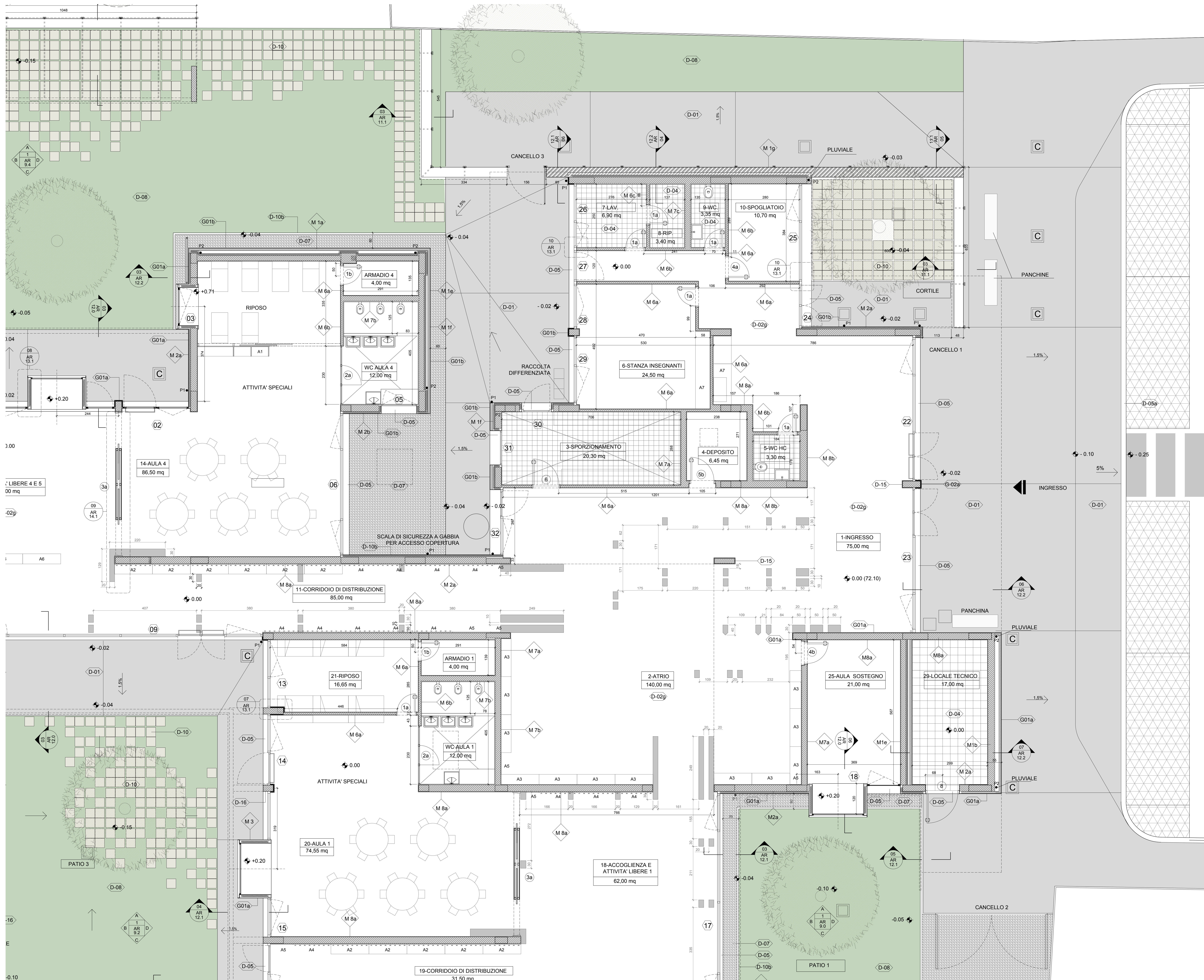
01 Pianta degli interni - Stralcio 1 1/50