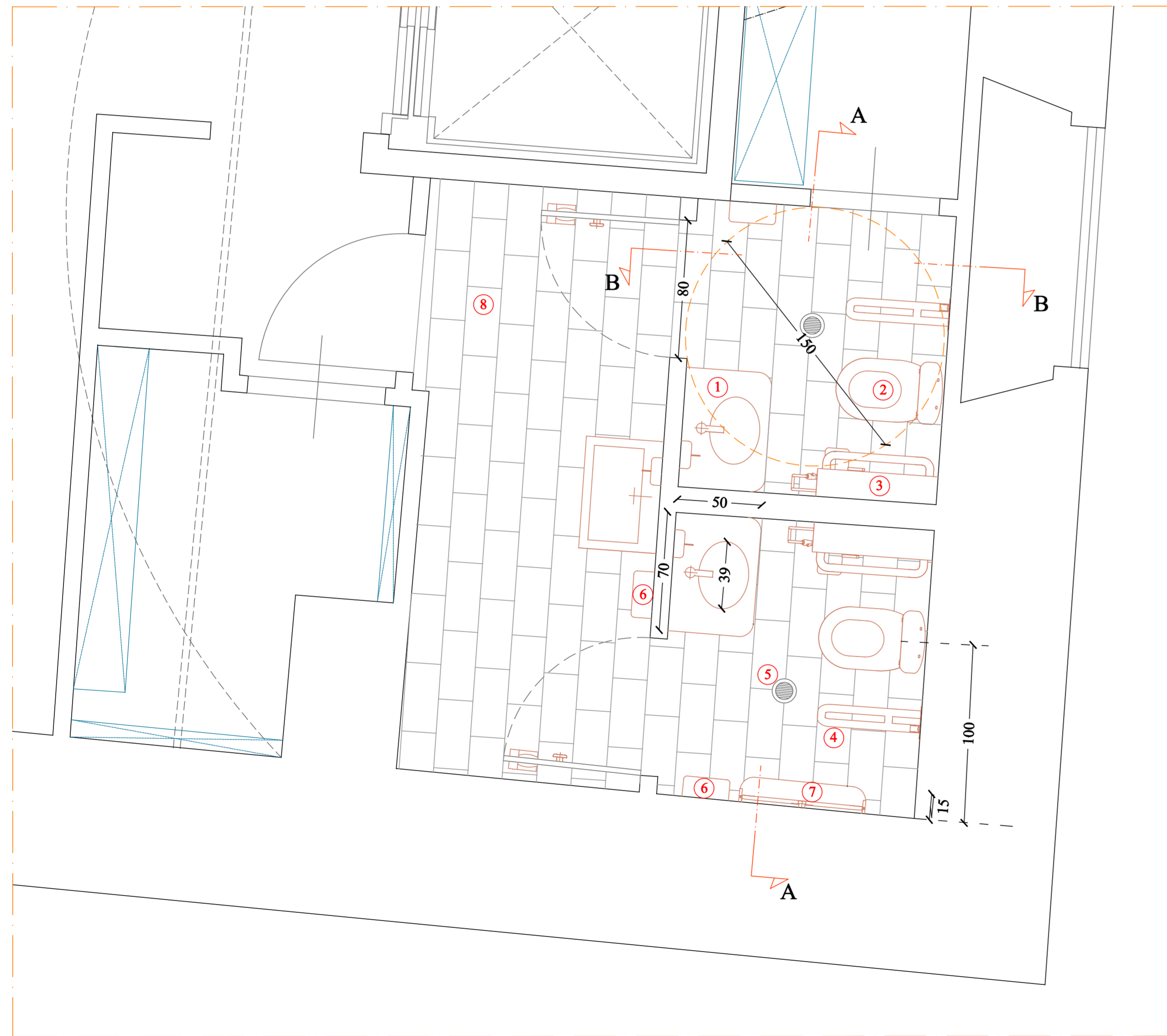
PIANTA SERVIZI IGIENICI - Scala 1:20