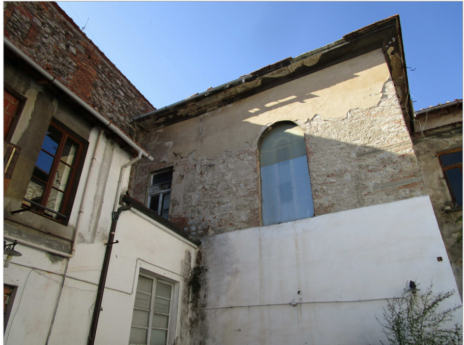
Foto 5: vista dalla corte interna dell'ulteriore edificio con copertura da risanare