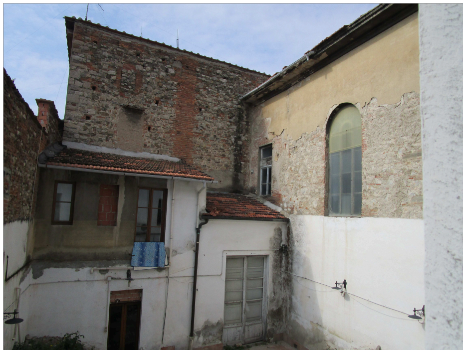
Foto 6: vista dalla corte interna dell'ulteriore edificio con copertura da risanare