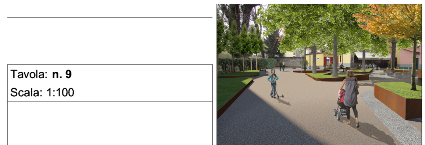
Tavola: n. 9 Scala: 1:100

Progettisti Progettista opere architettoniche Massimo Fabbrì Michela Brachi Coordinatore sicurezza in fase di progettazione Alessandro Pizzagli Coprogettazione opere architettoniche Alessia Bettazzi Collaborazione Irene Pannuto, Silvia Pinzauti, Roberta Russo, Viola Valeri