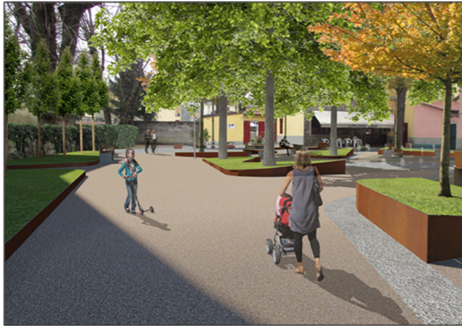
Tavola: n. 11 Scala: 1:100

© Copyright Comune di Prato - Servizio Lavori Pubblici è vietata la riproduzione anche parziale del documento