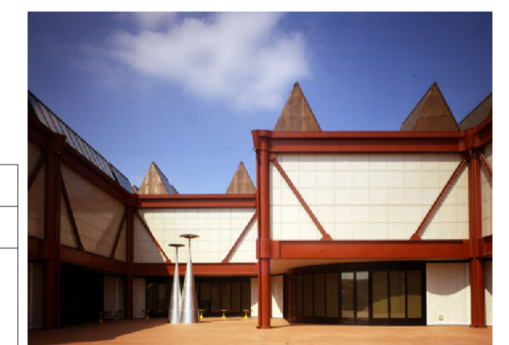
Tavola n. A - 10

Progettista opere architettoniche Arch. Antonio Silvestri - Comune di Prato Progettista opere strutturali - strutture esistenti Ing. Francesco Sanzo - Comune di Prato Progettista opere strutturali - nuove strutture ACS ingegneri - Ing. Iacopo Ceramelli Progettista impianti meccanici Ing. Dante Di Carlo Progettista impianti elettrici CMA srl - Ing. Maurizio Mazzanti Coordinatore sicurezza in fase di progettazione Arch. Paola Falaschi Collaboratori alla progettazione Geom. Michele Faranda Arch. Francesco Baldi Ing. Francesco Guarducci