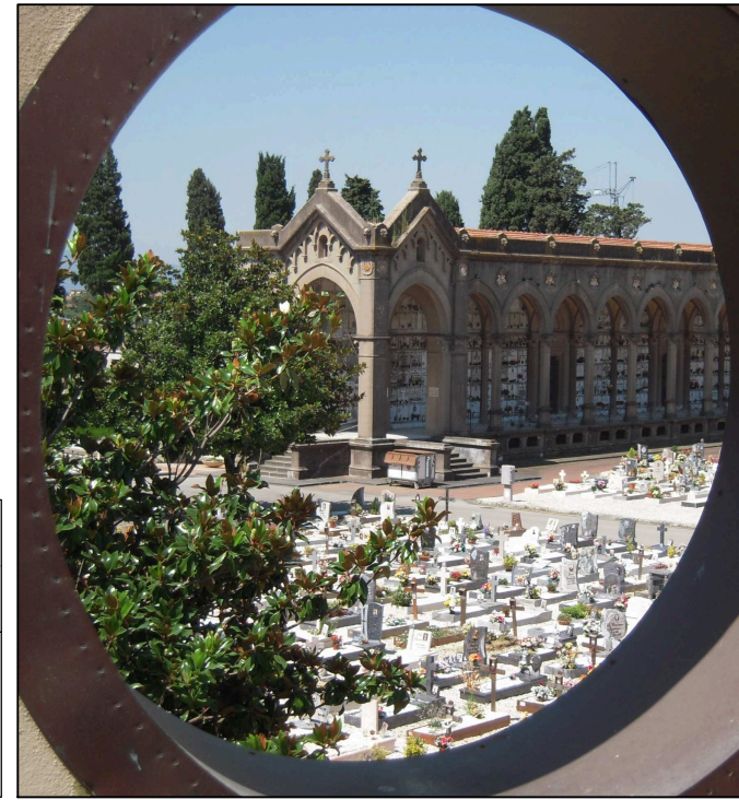
Tavola: 3.8 Scala: 1:200

© Copyright Comune di Prato è vietata la riproduzione anche parziale del documento