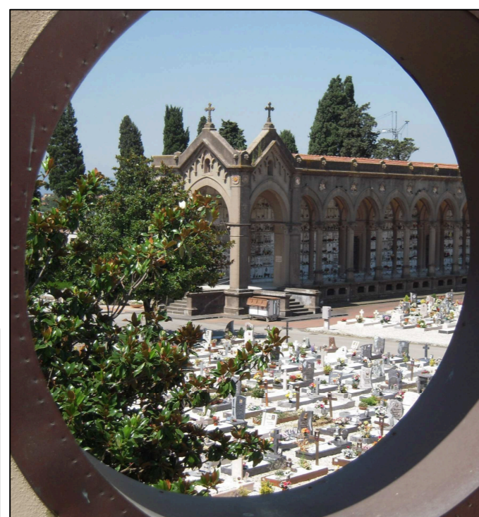
Tavola: 3.7 Scala: 1:200

© Copyright Comune di Prato è vietata la riproduzione anche parziale del documento