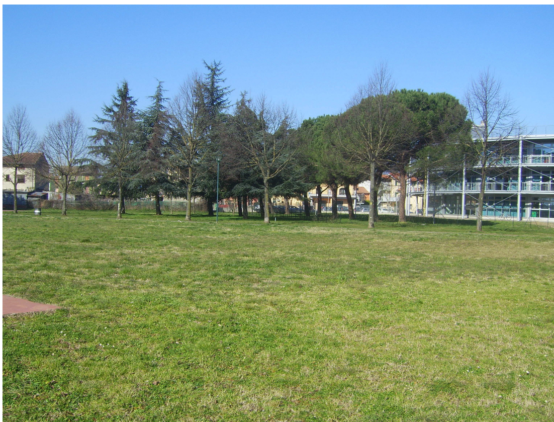
Fig.1 Ala Sud completata con I° e II° Lotto