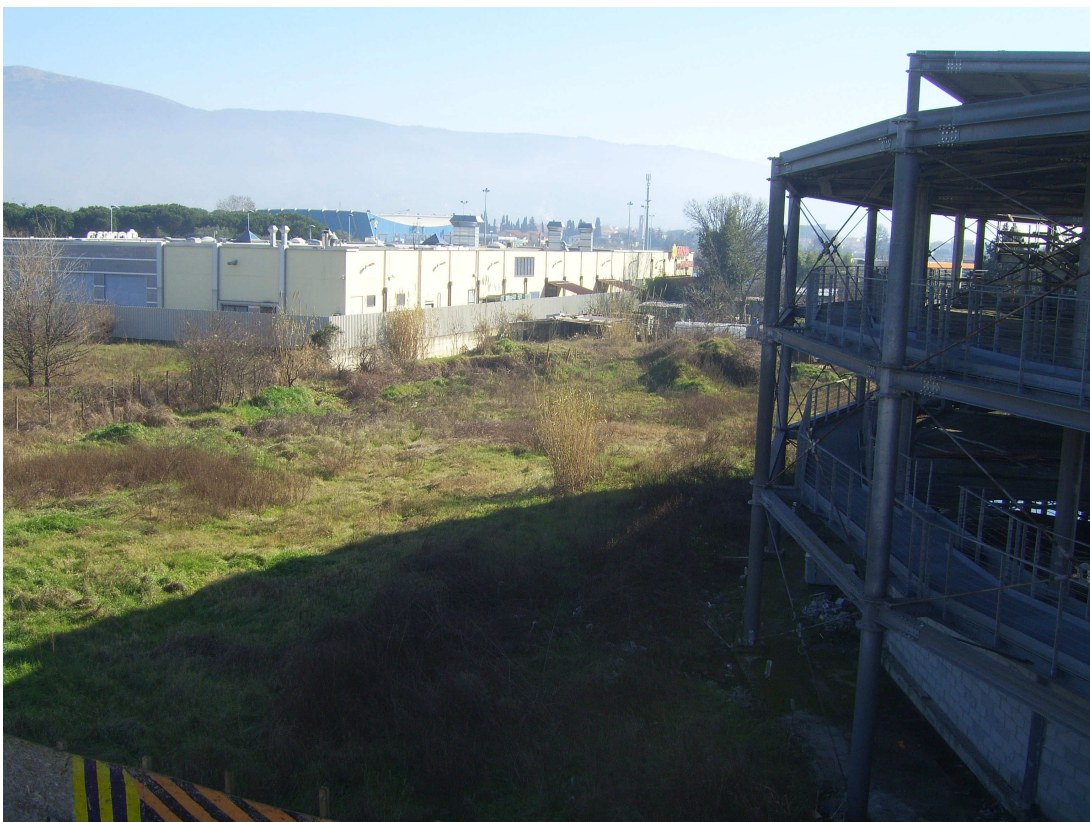
Fig.3 veduta della zona di destinazione per baraccamenti e servizi