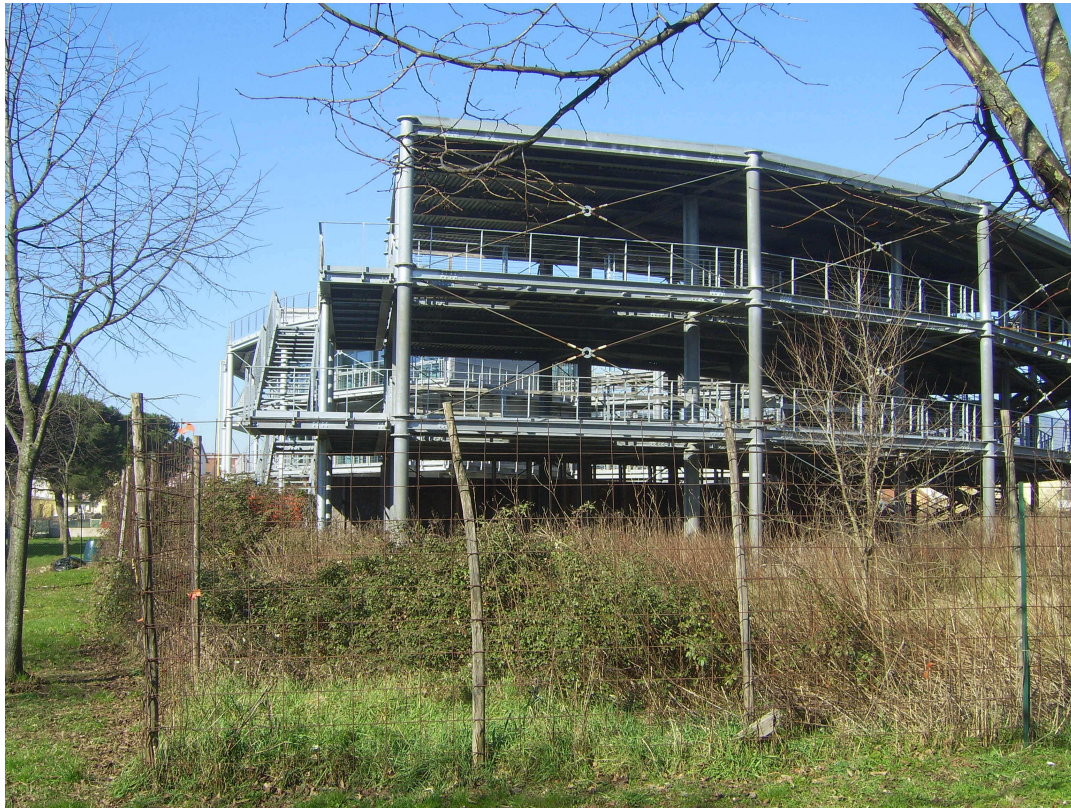
Fig.2 Edificio da completare III° Lott