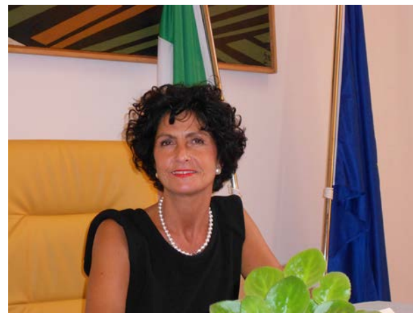
Assessore Istruzione Pubblica Rita Pieri

Colgo l'occasione per augurare a tutti i bambini e ragazzi, alle loro famiglie ed a tutti gli operatori della scuola, un buon anno scolastico, consapevoli della complessità del mondo scolastico, delle criticità che sapremo affrontare e delle opportunità che, insieme, sapremo cogliere.