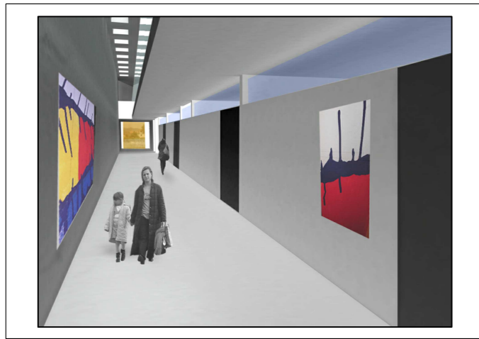
Tavola: M1 Scala: 1:300 Spazio riservato agli uffici: