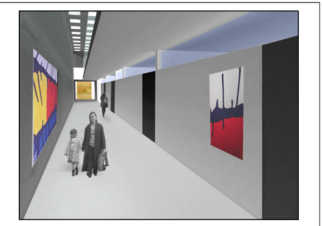
Tavola: Elaborato R