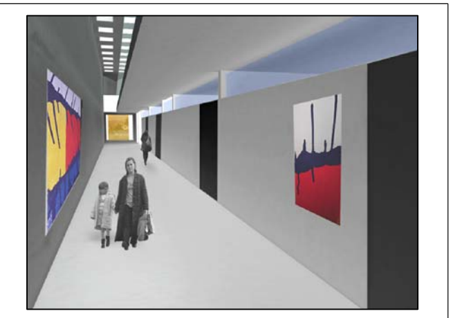
Tavola: Elaborato D