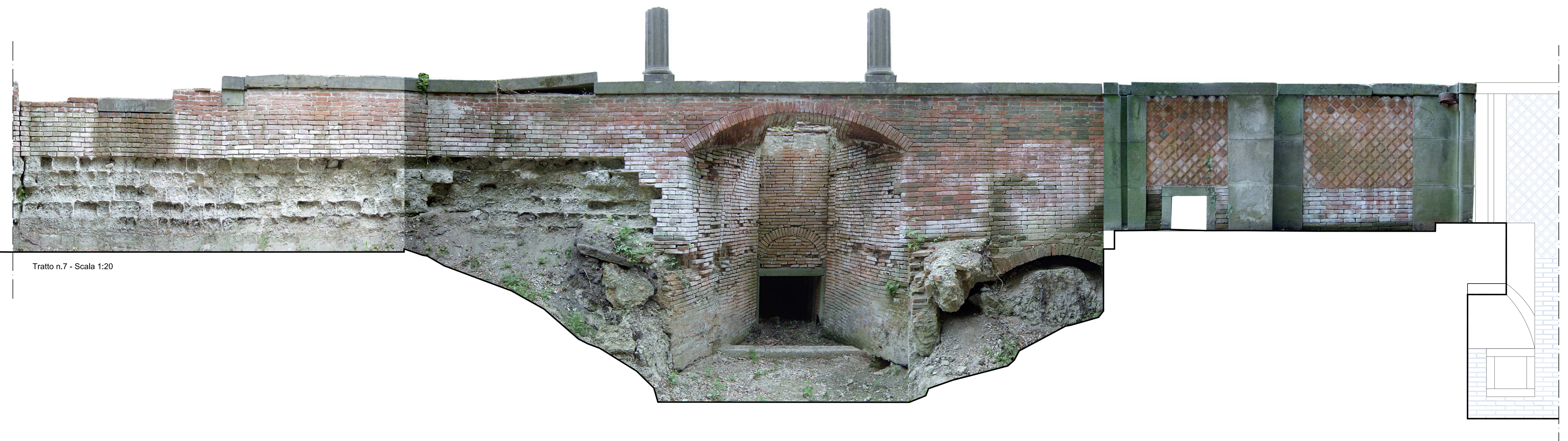
Tratto n.7 - Scala 1:20