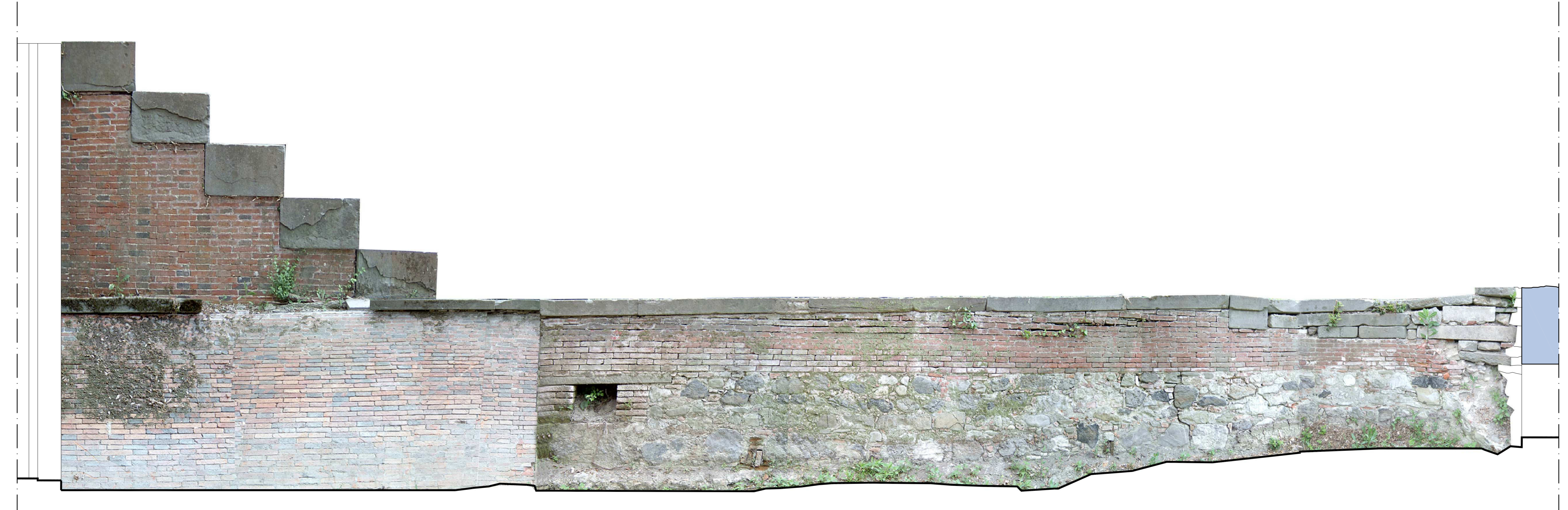
Tratto n.8 - Scala 1:20