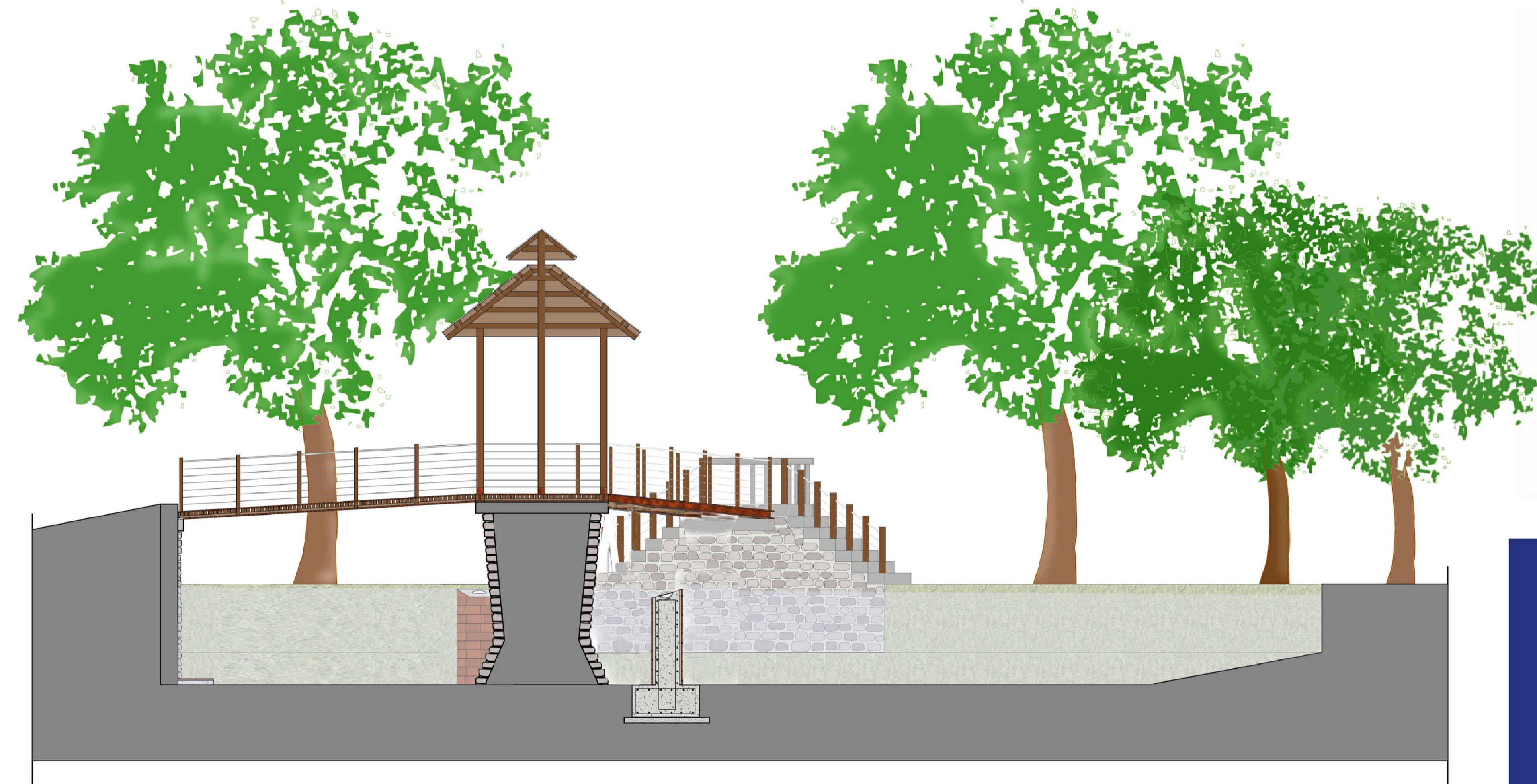
SEZIONE-PROSPETTO D-D' SCALA 1:50