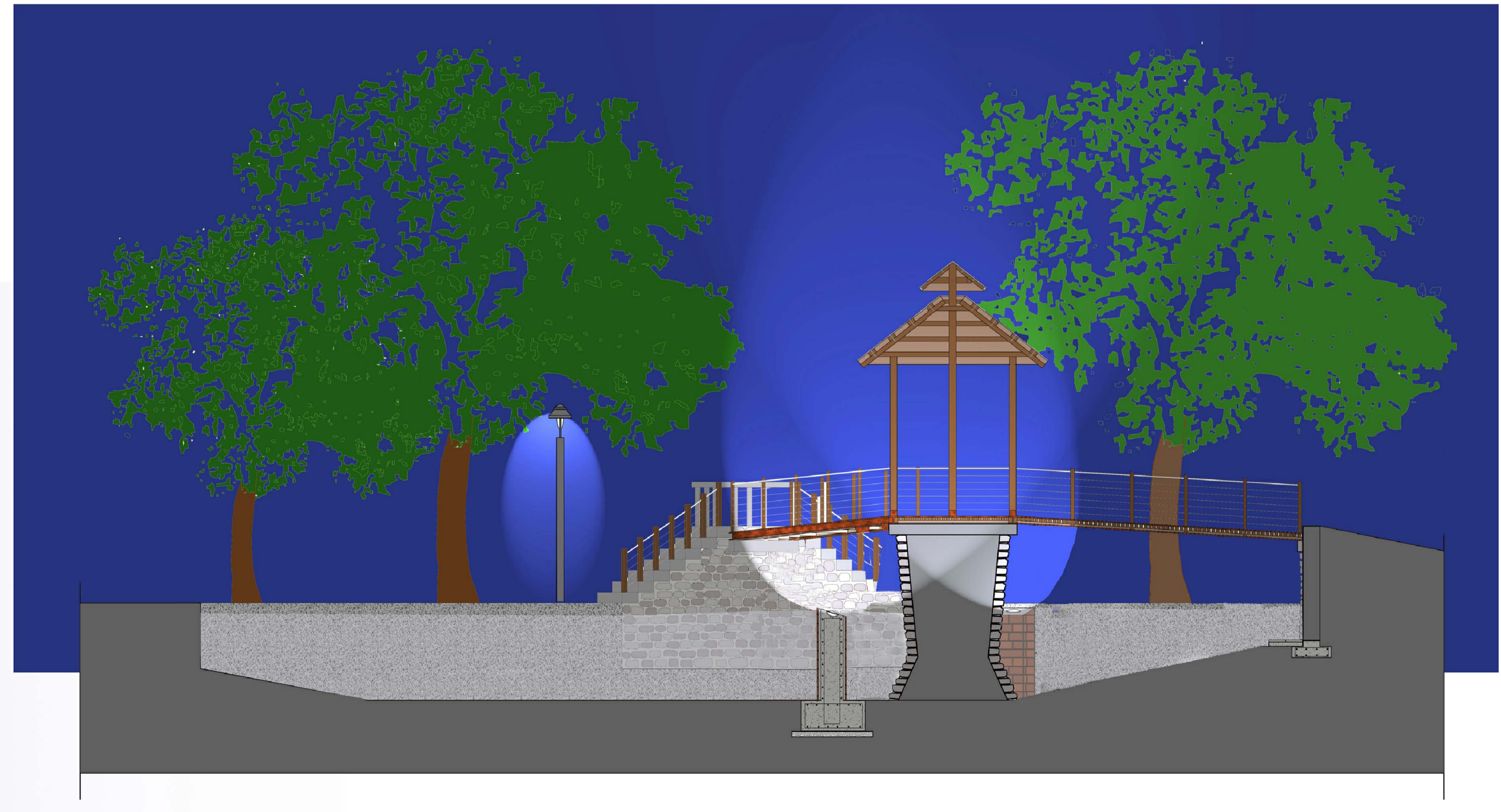
SEZIONE-PROSPETTO E-E' SCALA 1:50