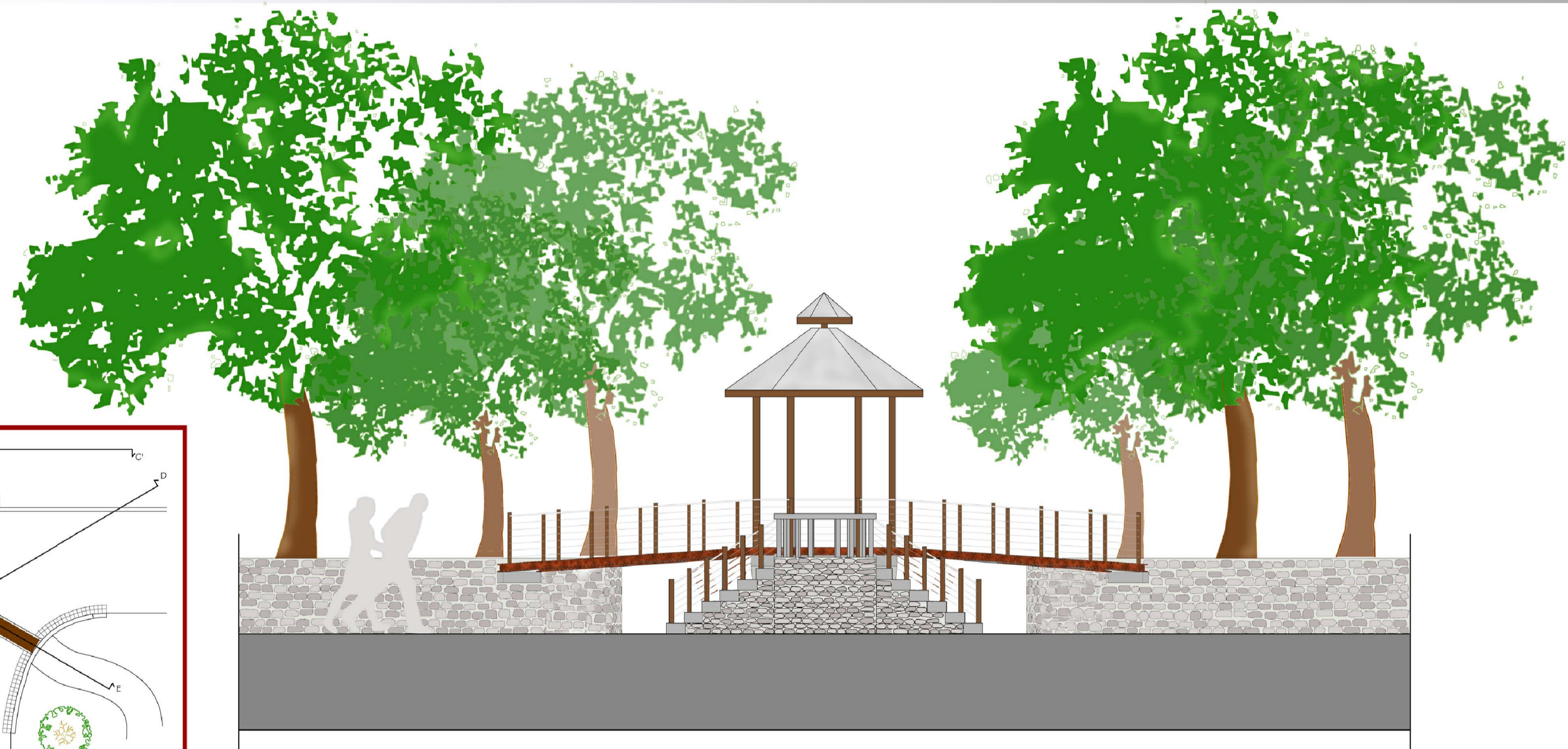
PROSPETTO C-C' SCALA 1:50