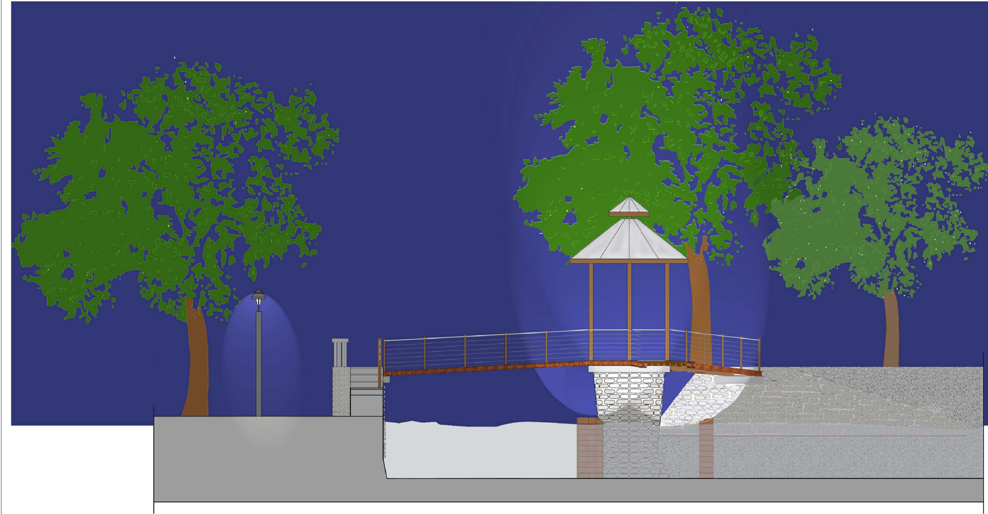
PROSPETTO B-D' SCALA 1:50