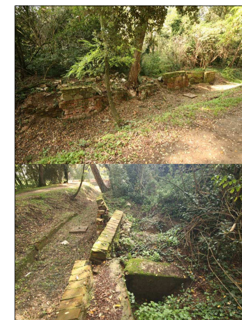
N.15 ARGINATURA IN OPERA MURARIA