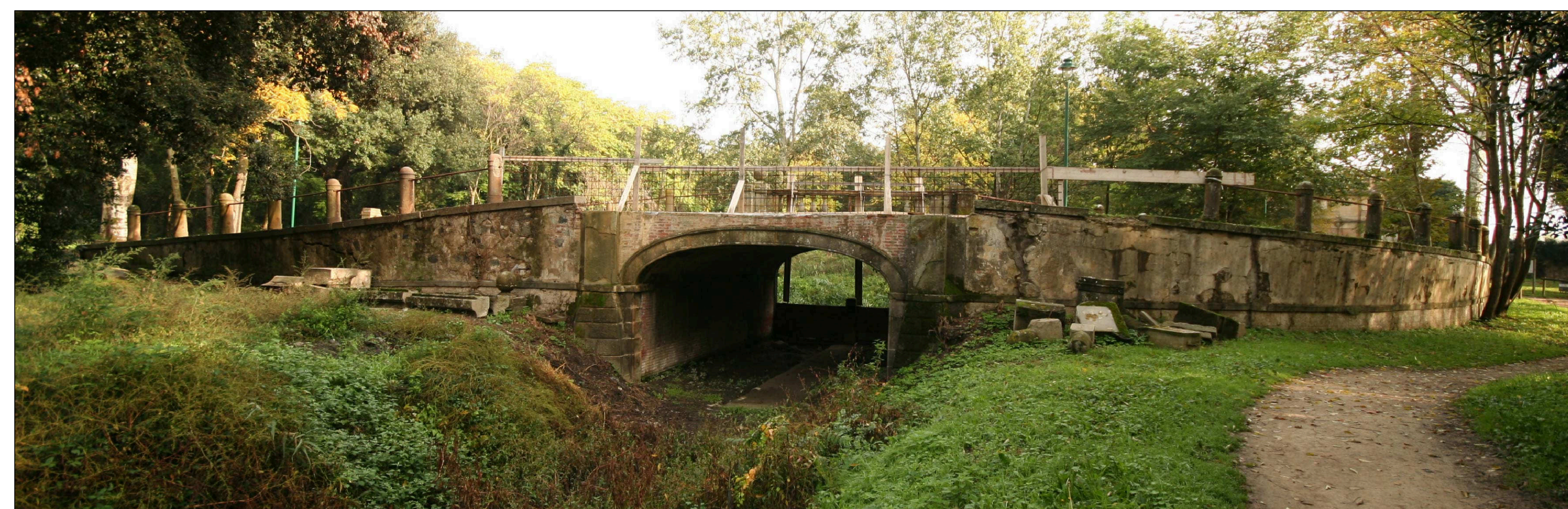
N.12 PONTE ALLA CURVA

Area interessata dal progetto di restauro