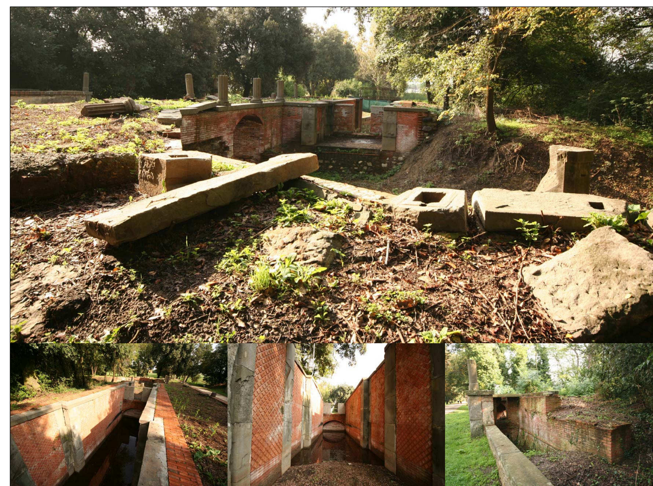
N.16 COMPLESSO DELLA CHIUSA O DARSENA MERIDIONALE