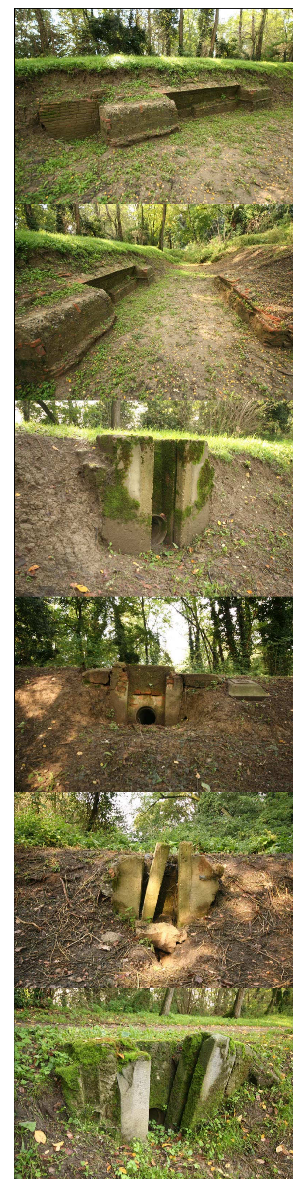
N.13 SERIE DI STRUTTURE IDRAULICHE E MANUFATTI