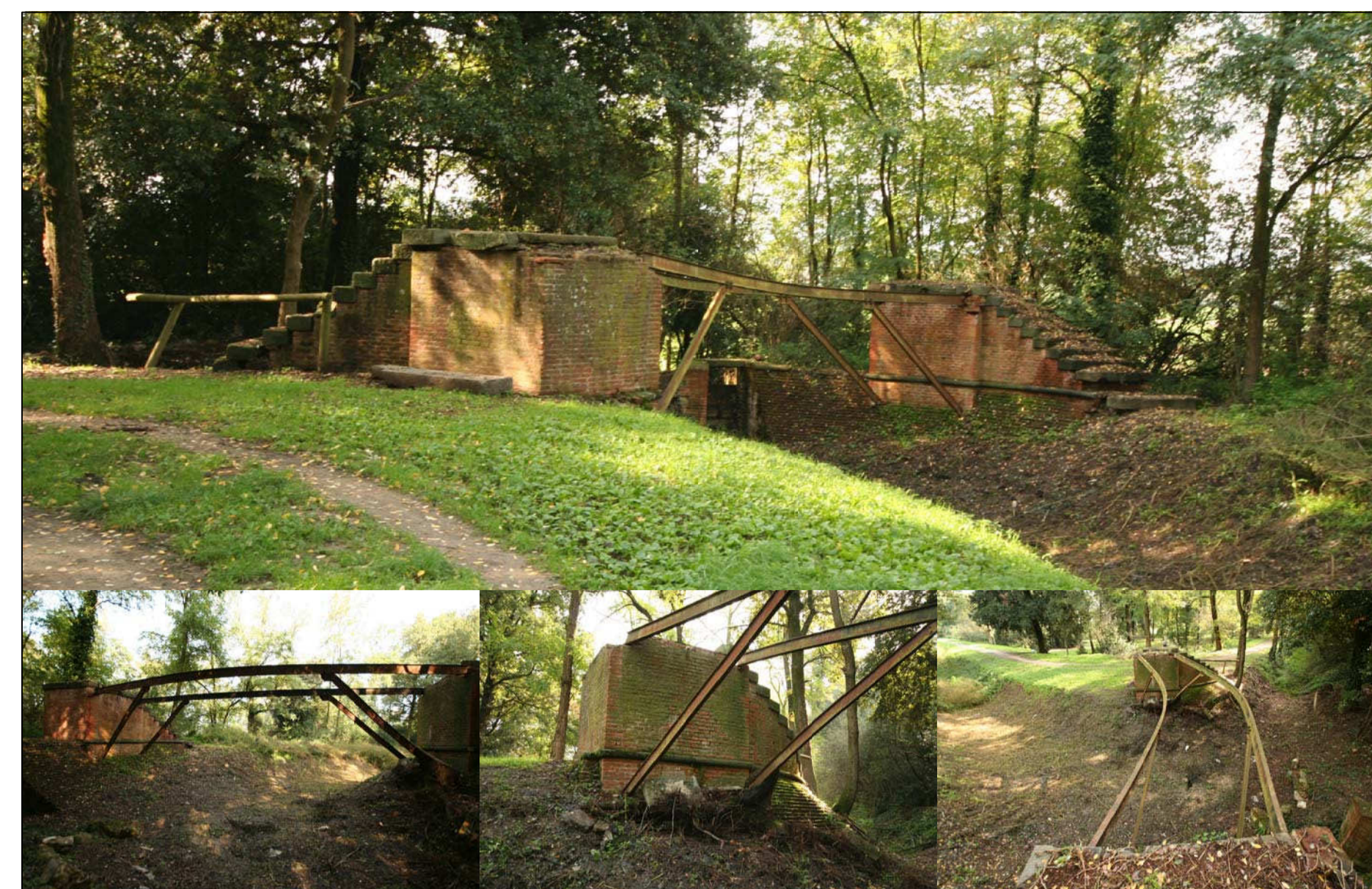
N.14 PONTE CON PASSERELLA IN FERRO