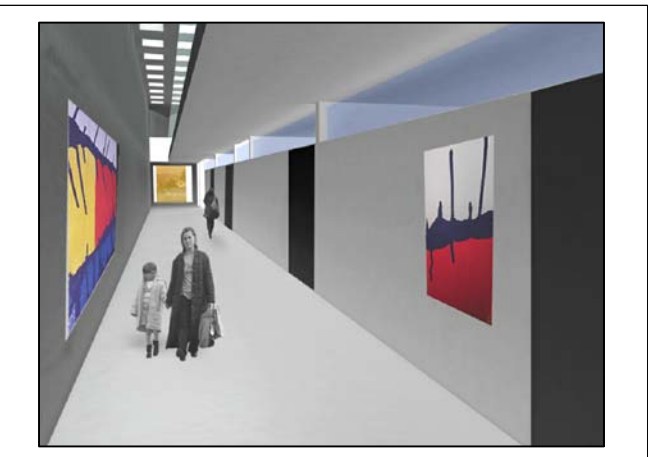
Tavola: Elaborato E