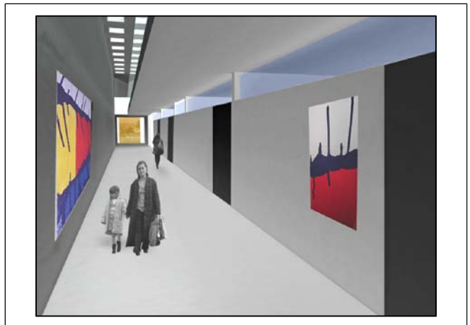
Tavola: Elaborato B