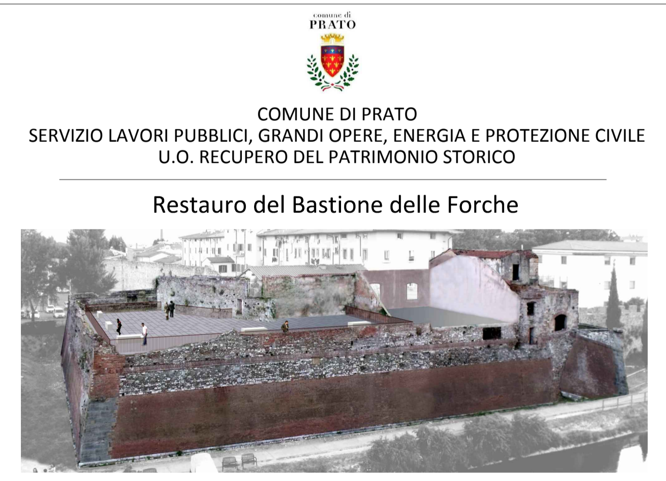
Prospetto Sud - Par.02

COMUNE DI PRATO SERVIZIO LAVORI PUBBLICI, GRANDI OPERE, ENERGIA E PROTEZIONE CIVILE U.O. RECUPERO DEL PATRIMONIO STORICO