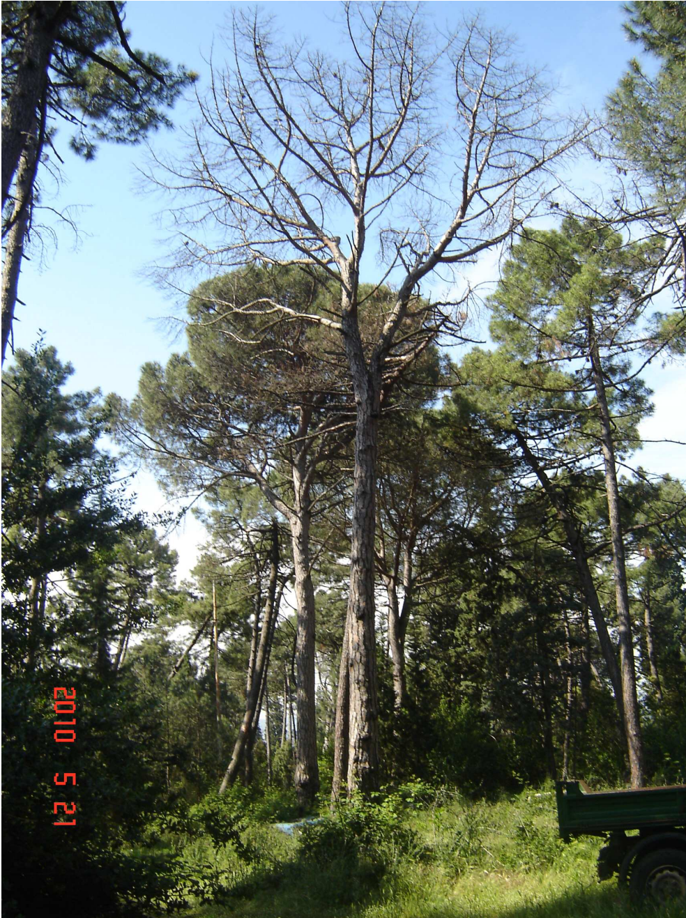
Foto 18 (Vista area inserimento rimessa mezzi con alcuni pini attaccati dal parassita Matzucoccus feytaudi )