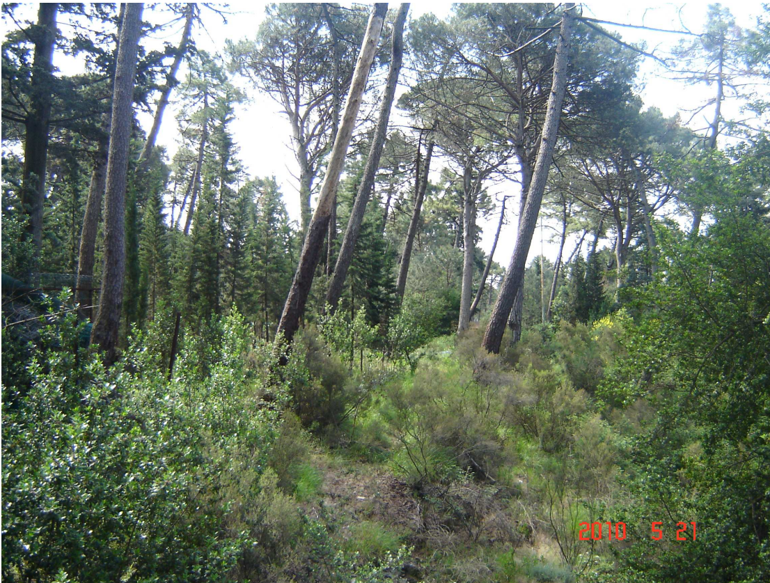
Foto 17 (Vista area inserimento rimessa mezzi con alcuni pini attaccati dal parassita Matzucoccus feytaudi )